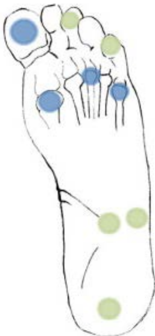
Abb. 2: geeignete Untersuchungsstellen

Die vier im Minimum an der Fusssohle zu testenden Stellen (pro Fuss) sind in der unteren Abbildung (Abb. 2) blau markiert, weitere geeignete Stellen in grün.